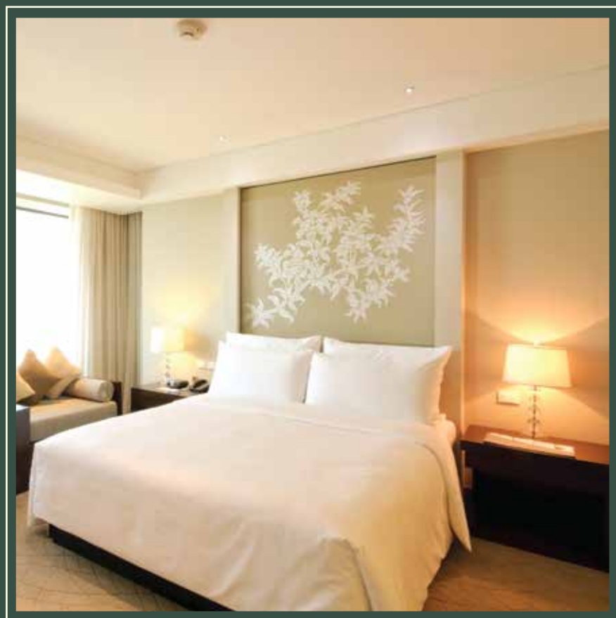
IMAGEN A MODO ILUSTRATIVO