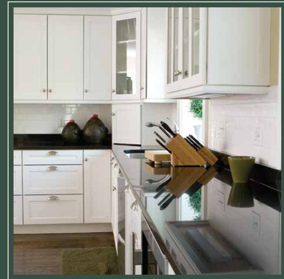
IMAGEN A MODO ILUSTRATIVO