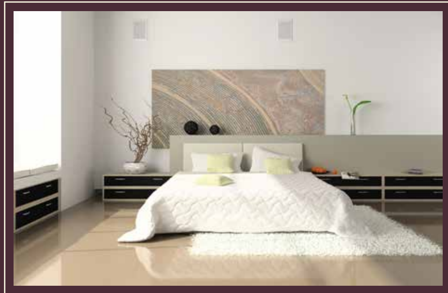
IMAGEN A MODO ILUSTRATIVO