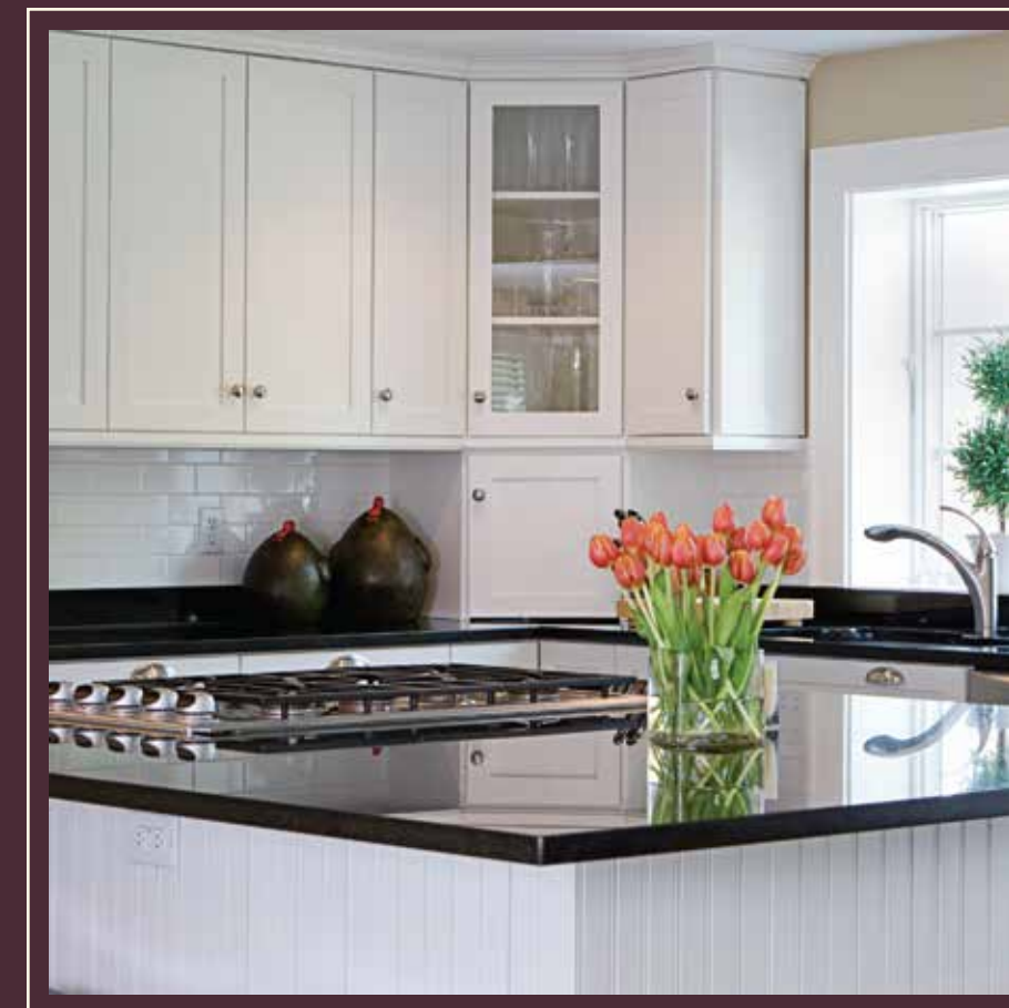
IMAGEN A MODO ILUSTRATIVO